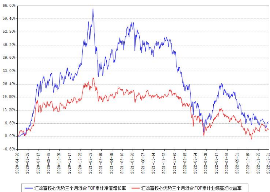
汇添富核心优势三个月混合FOF累计净值增长率与同期业绩基准收益率对比图

注：本基金建仓期为本《基金合同》生效之日（2020年04月26日）起6个月，建仓期结束时各项资产配置比例符合合同约定。