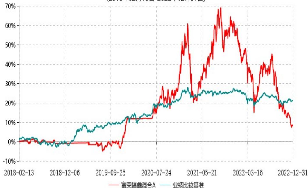
富荣福鑫混合C累计净值增长率与业绩比较基准收益率历史走势对比图