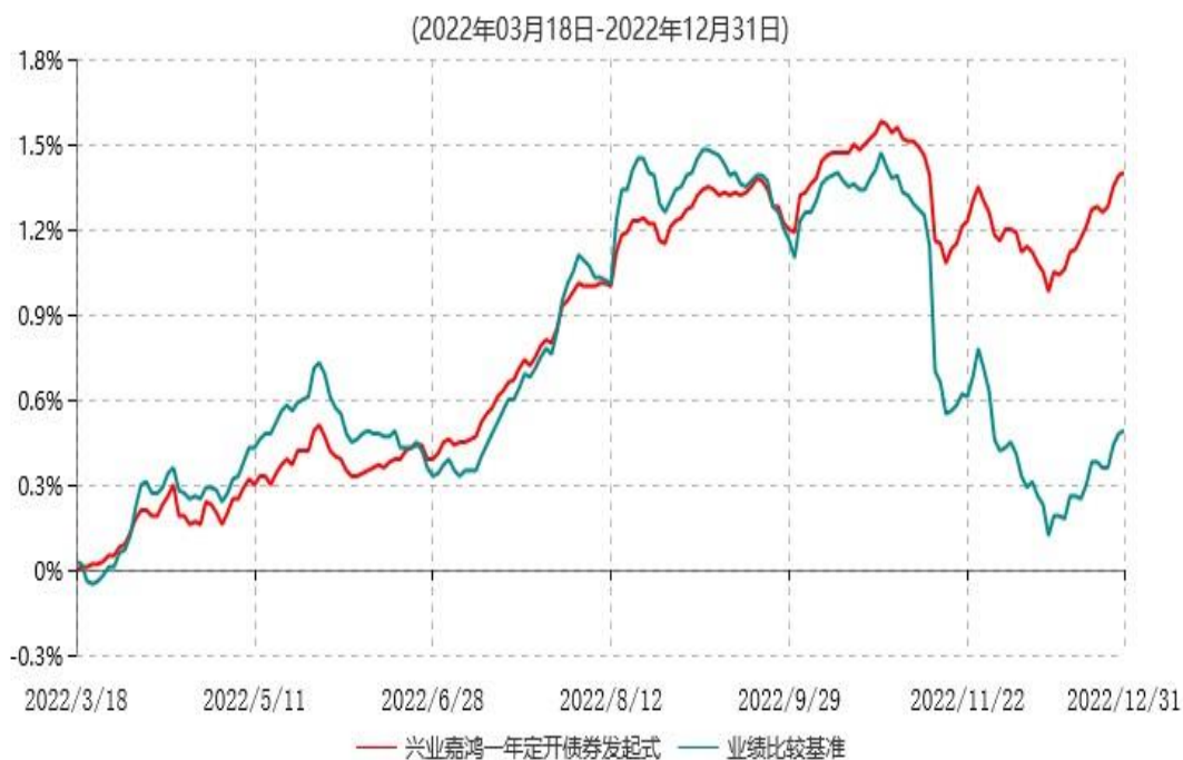
兴业嘉鸿一年定期开放债券型发起式证券投资基金累计净值增长率与业绩比较基准收益率历史走势对比图

注：1、本基金基金合同于2022年03月18日生效，截至本报告期末本基金基金合同生效未满一年。