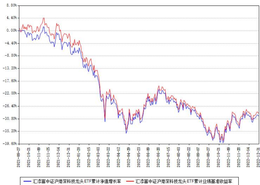
汇添富中证沪港深科技龙头ETF累计净值增长率与同期业绩基准收益率对比图

注：本基金建仓期为本《基金合同》生效之日（2021年09月27日）起6个月，建仓期结束时各项资产配置比例符合合同约定。