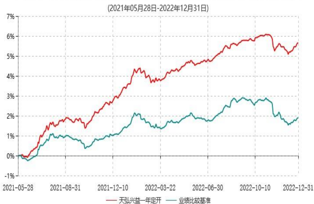
天弘兴益一年定期开放债券型发起式证券投资基金累计净值增长率与业绩比较基准收益率历史走势对比图