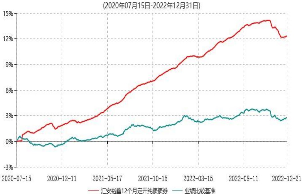
汇安裕鑫12个月定期开放纯债债券型发起式证券投资基金累计净值增长率与业绩比较基准收益率历史走势对比图