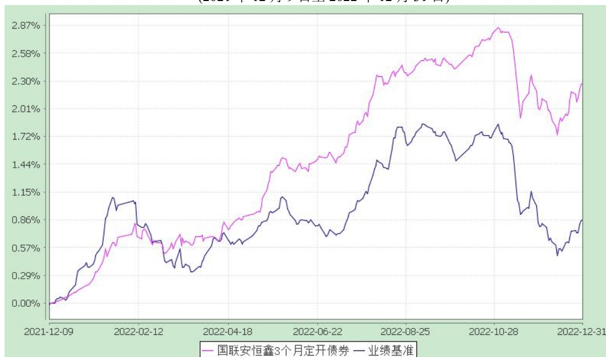
国联安恒鑫 3 个月定期开放纯债债券型证券投资基金 自基金合同生效以来份额累计净值增长率与业绩比较基准收益率的历史走势对比图 (2021 年 12 月 9 日至 2022 年 12 月 31 日)

注：1、本基金业绩比较基准为中债综合指数收益率； 2、本基金基金合同于 2021 年 12 月 9 日生效； 3、本基金建仓期为自基金合同生效之日起的 6 个月。本基金建仓期结束距本报告期末不满一年，建仓期结束时各项资产配置符合合同约定； 4、上述基金业绩指标不包括持有人认购或交易基金的各项费用，计入费用后实际收益水平要低于所列数字。