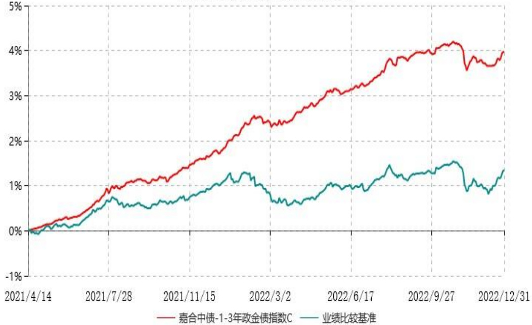
嘉合中债-1-3年政金债指数C累计净值增长率与业绩比较基准收益率历史走势对比图 (2021年04月14日-2022年12月31日)