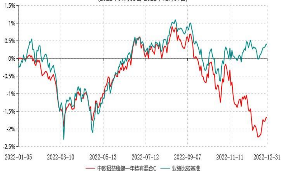
中欧招益稳健一年持有混合C累计净值增长率与业绩比较基准收益率历史走势对比图 (2022年01月05日-2022年12月31日)

注：本基金基金合同生效日期为2022年1月5日，自基金合同生效日起到本报告期末不满一年，按基金合同的规定，本基金自基金合同生效起六个月为建仓期，建仓期结束时各项资产配置比例已符合基金合同约定。