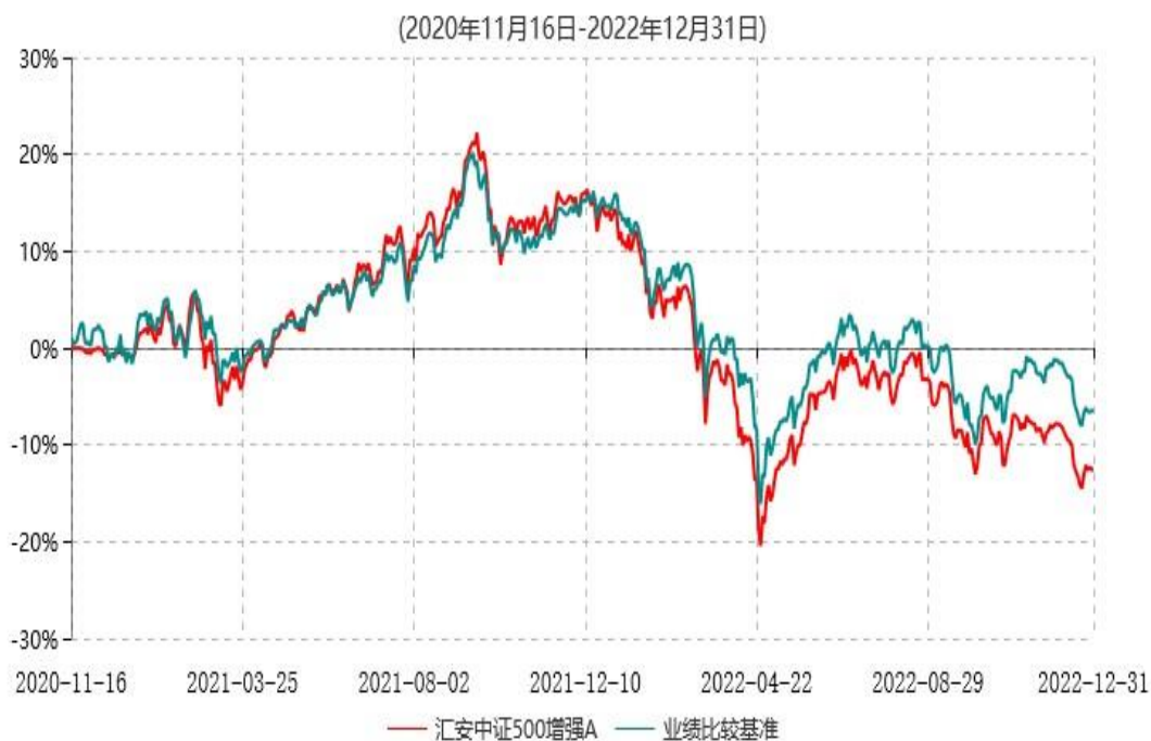
汇安中证500增强A累计净值增长率与业绩比较基准收益率历史走势对比图