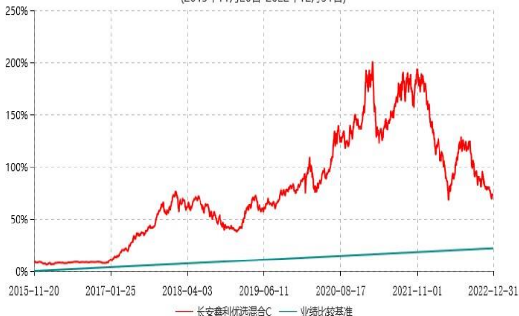
长安鑫利优选混合C累计净值增长率与业绩比较基准收益率历史走势对比图 (2015年11月20日-2022年12月31日)

本基金基金合同生效日为2015年05月18日，按基金合同规定，本基金自基金合同生效起6个月为建仓期，截止到建仓期结束时，本基金的各项投资组合比例已符合基金合同的相关规定。图示日期为2015年05月18日至2022年12月31日。