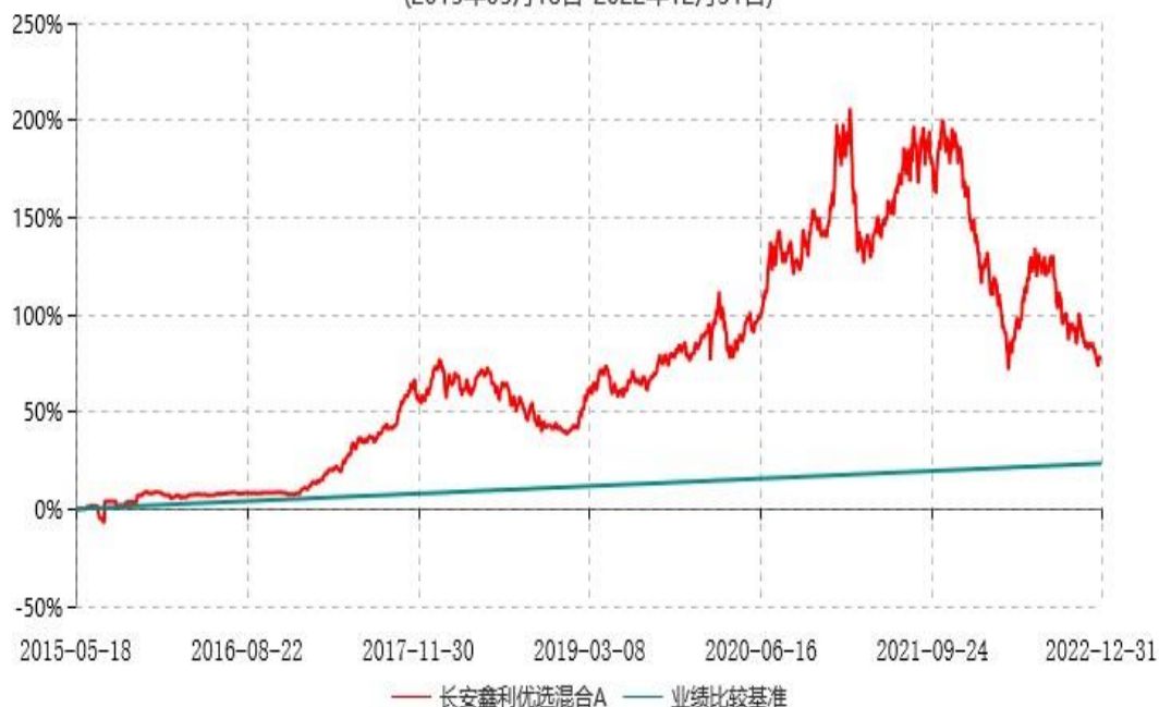
长安鑫利优选混合A累计净值增长率与业绩比较基准收益率历史走势对比图 (2015年05月18日-2022年12月31日)

本基金基金合同生效日为2015年05月18日，按基金合同规定，本基金自基金合同生效起6个月为建仓期，截止到建仓期结束时，本基金的各项投资组合比例已符合基金合同的相关规定。图示日期为2015年05月18日至2022年12月31日。