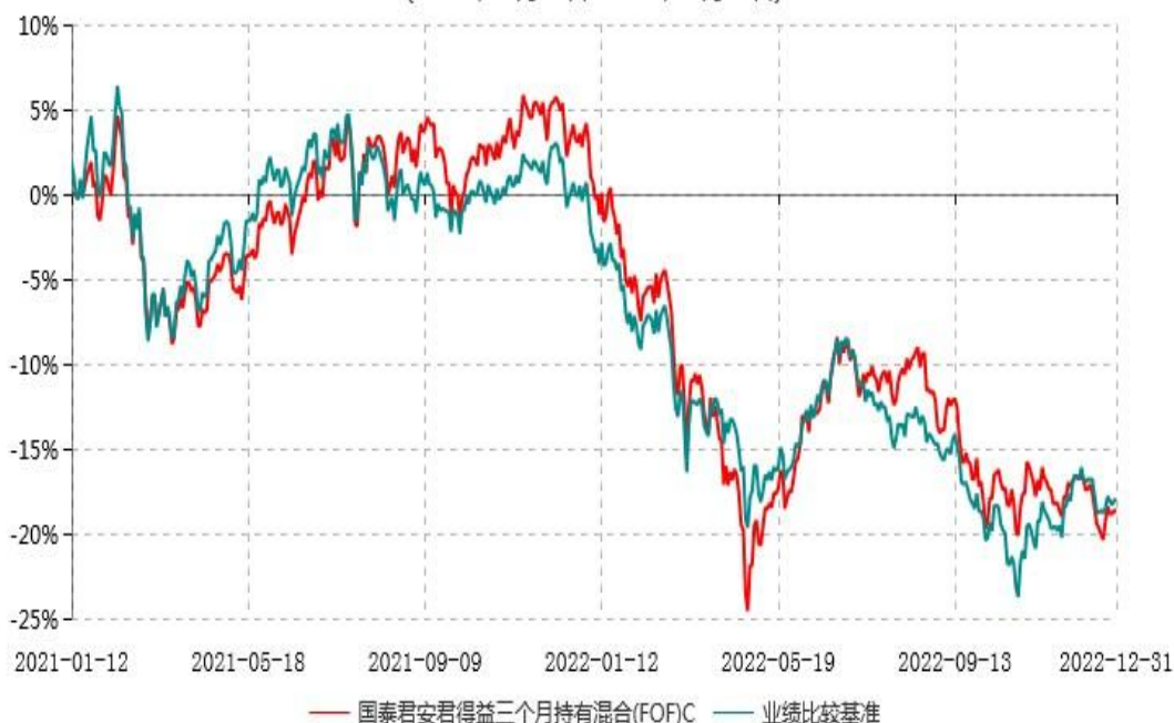
国泰君安君得益三个月持有混合(FOF)C累计净值增长率与业绩比较基准收益率历史走势对比图 (2021年01月12日-2022年12月31日)

注：本基金于2020年11月16日参公生效，C类份额于2021年1月12日首次申购确认，C类份额当期的相关数据和指标按实际存续期（即2021年1月12日至2022年12月31日）计算。