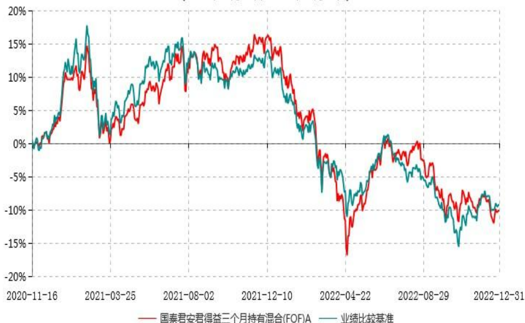
国泰君安君得益三个月持有混合(FOF)A累计净值增长率与业绩比较基准收益率历史走势对比图 (2020年11月16日-2022年12月31日)

注：本基金于2020年11月16日参公生效，A类份额当期的相关数据和指标按实际存续期（即2020年11月16日至2022年12月31日）计算。