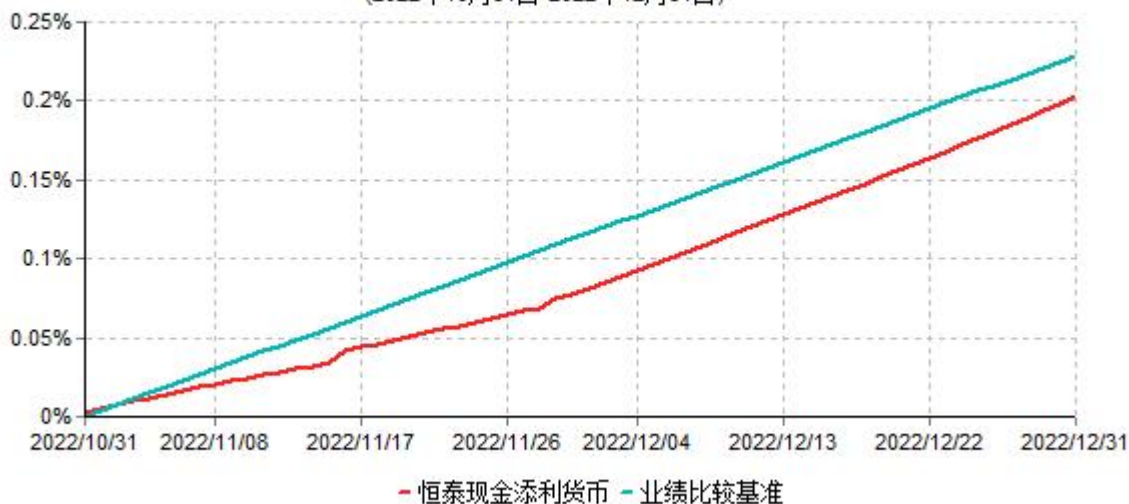
恒泰现金添利货币型集合资产管理计划累计净值收益率与业绩比较基准收益率历史走势对比图 (2022年10月31日-2022年12月31日)