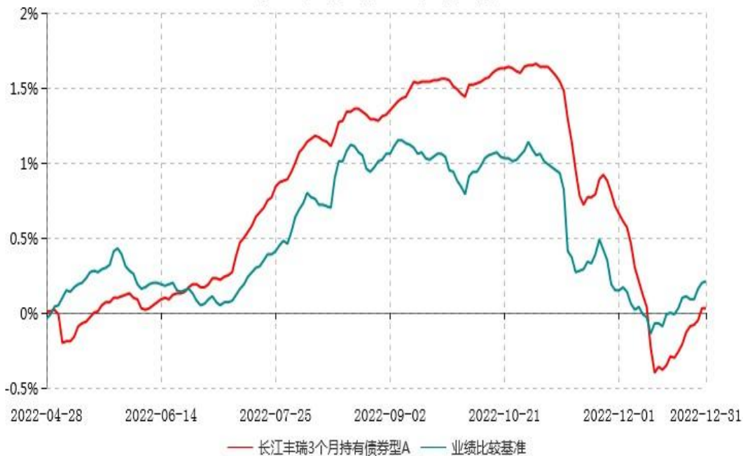
长江丰瑞3个月持有债券型A累计净值增长率与业绩比较基准收益率历史走势对比图 (2022年04月28日-2022年12月31日)