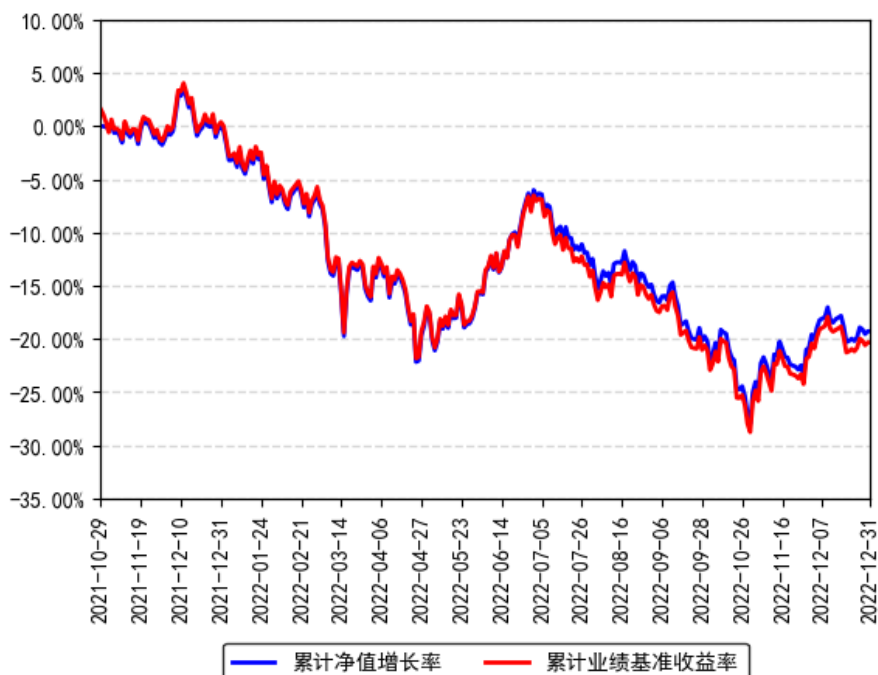
南方MSCI中国A50互联互通ETF累计净值增长率与同期业绩比较基准收益率的历史走势对比图