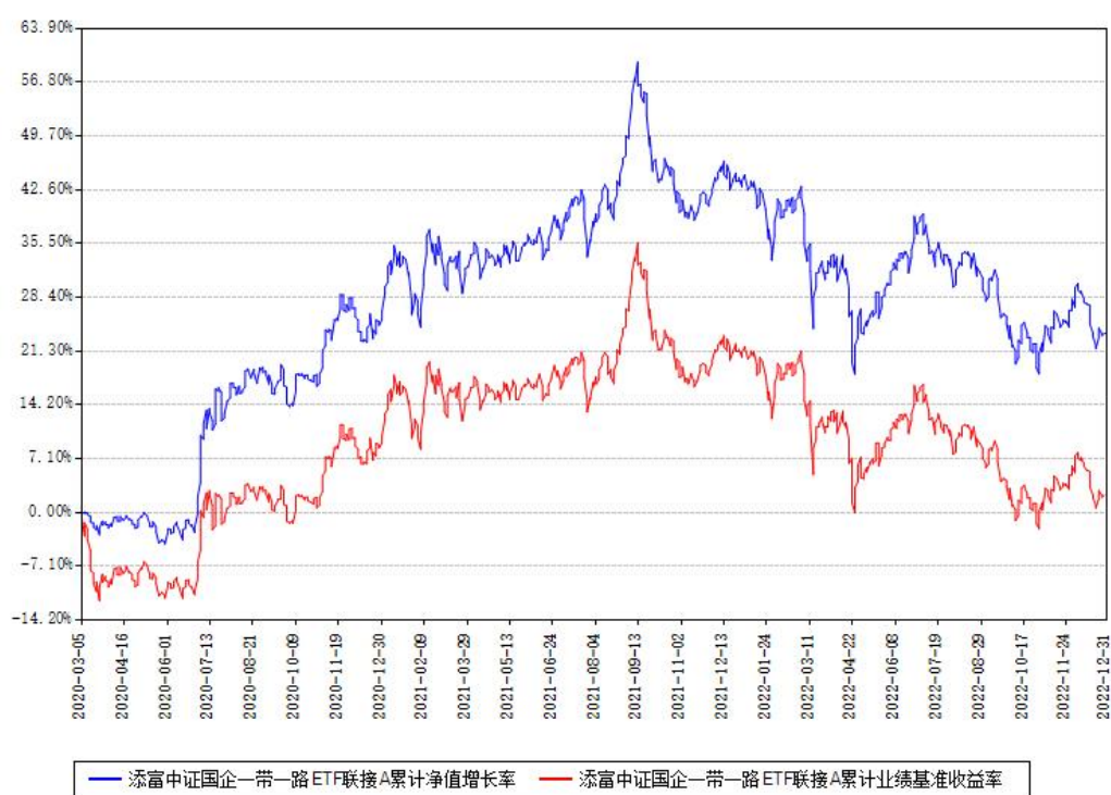
添富中证国企一带一路ETF联接A累计净值增长率与同期业绩比较基准收益率对比图