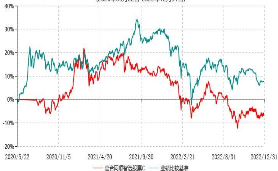
嘉合同顺智选股票C累计净值增长率与业绩比较基准收益率历史走势对比图 (2020年05月22日-2022年12月31日)