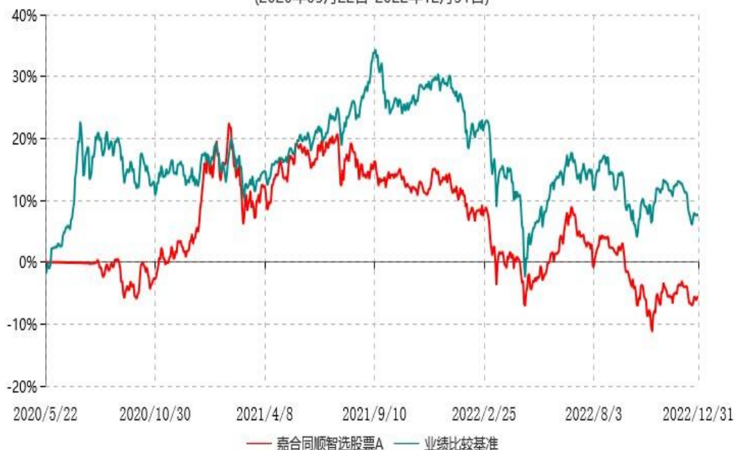
嘉合同顺智选股票A累计净值增长率与业绩比较基准收益率历史走势对比图 (2020年05月22日-2022年12月31日)