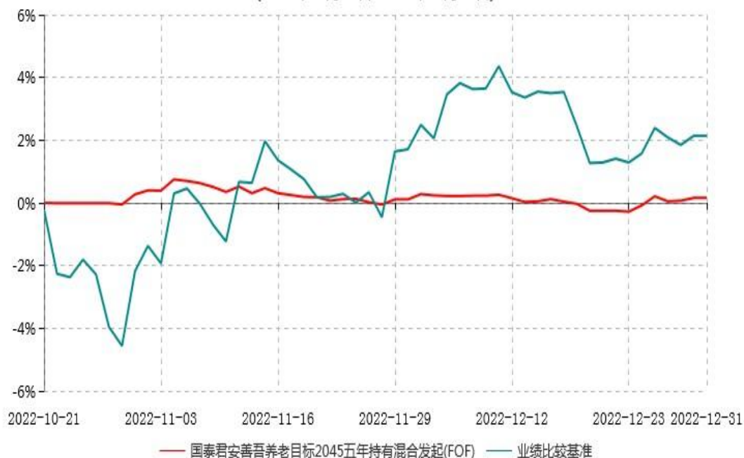
国泰君安善吾养老目标日期2045五年持有期混合型发起式基金中基金 (FOF) 累计净值增长率与业绩比较基准收益率历史走势对比 (2022年10月21日-2022年12月31日)