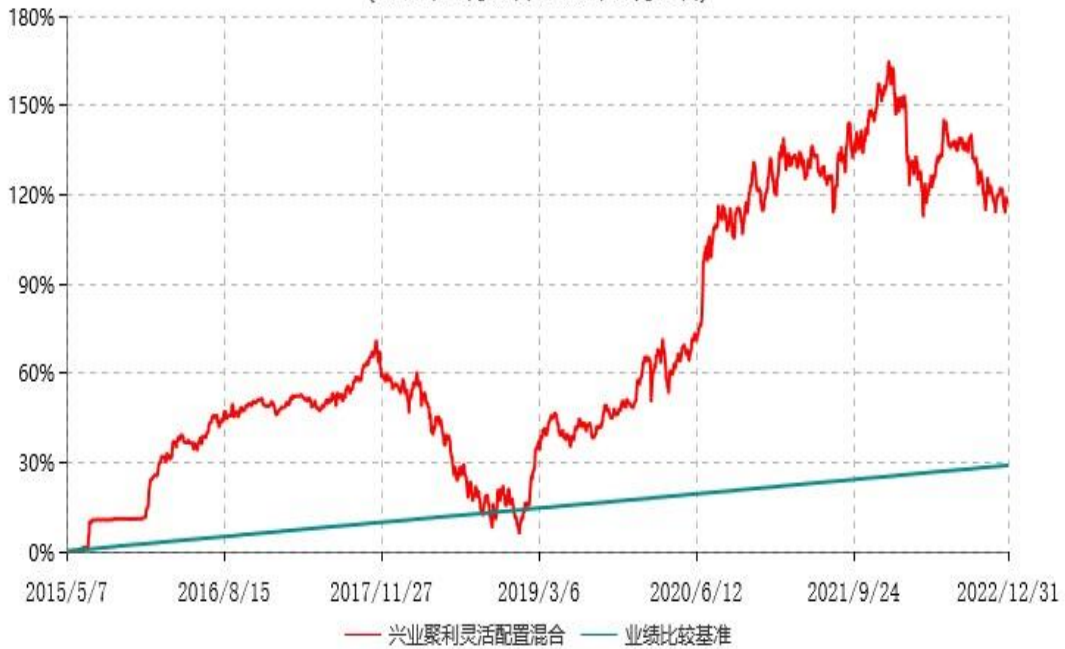
兴业聚利灵活配置混合型证券投资基金累计净值增长率与业绩比较基准收益率历史走势对比图 (2015年05月07日-2022年12月31日)