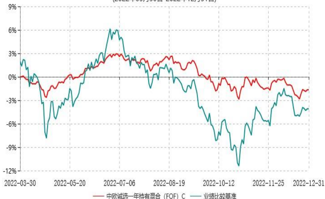
中欧诚选一年持有混合（FOF）C累计净值增长率与业绩比较基准收益率历史走势对比图 (2022年03月30日-2022年12月31日)

注：本基金基金合同生效日期为2022年3月30日，自基金合同生效日起到本报告期末不满一年，按基金合同的规定，本基金自基金合同生效起六个月为建仓期，建仓期结束时各项资产配置比例已符合基金合同约定。