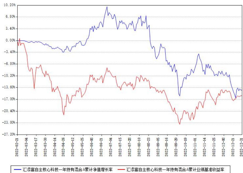
汇添富自主核心科技一年持有混合A累计净值增长率与同期业绩基准收益率对比图