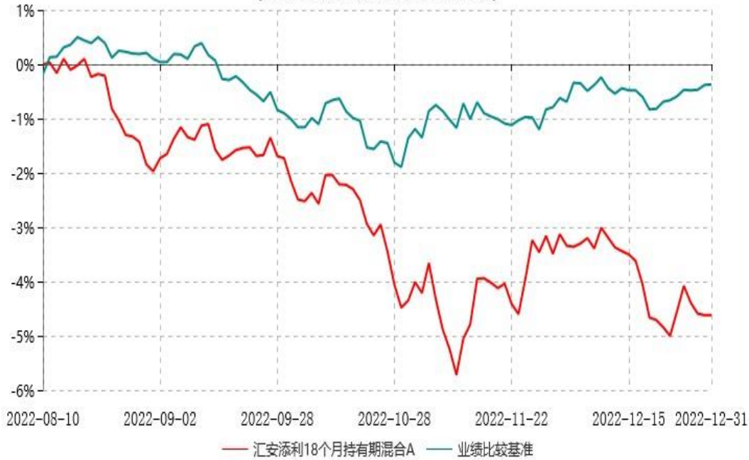
汇安添利18个月持有期混合C累计净值增长率与业绩比较基准收益率历史走势对比图