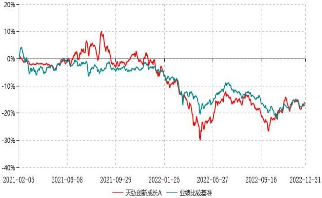
天弘创新成长C累计净值增长率与业绩比较基准收益率历史走势对比图