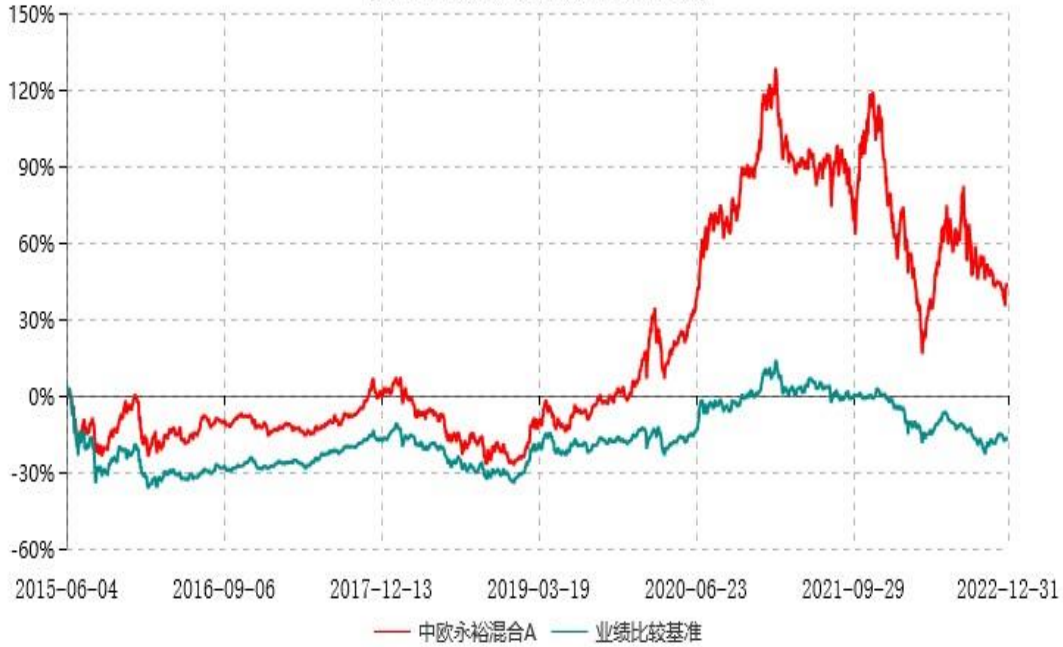
中欧永裕混合C累计净值增长率与业绩比较基准收益率历史走势对比图