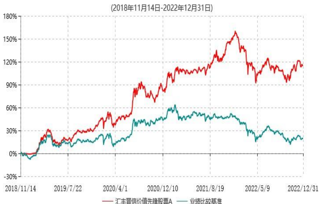
汇丰晋信价值先锋股票A累计净值增长率与业绩比较基准收益率历史走势对比图