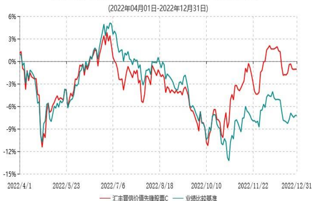
汇丰晋信价值先锋股票C累计净值增长率与业绩比较基准收益率历史走势对比图

4.上述基金净值增长率的计算已包含本基金所投资股票在报告期产生的股票红利收益。同期业绩比较基准收益率的计算未包含中证800指数成份股在报告期产生的股票红利收益。