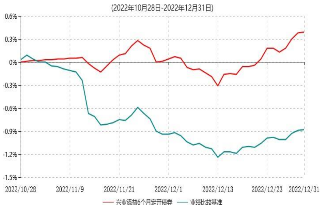
兴业添益6个月定期开放债券型证券投资基金累计净值增长率与业绩比较基准收益率历史走势对比图

注：1、本基金基金合同于2022年10月28日生效，截至报告期末本基金基金合同生效未 满一年。