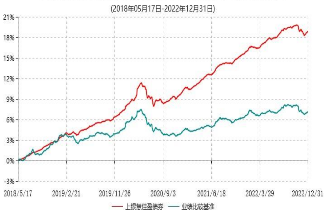
上银慧佳盈债券型证券投资基金累计净值增长率与业绩比较基准收益率历史走势对比图

注：本基金合同生效日为2018年5月17日，自基金合同生效日起6个月内为建仓期，建仓期结束时各项资产配置比例符合基金合同约定。