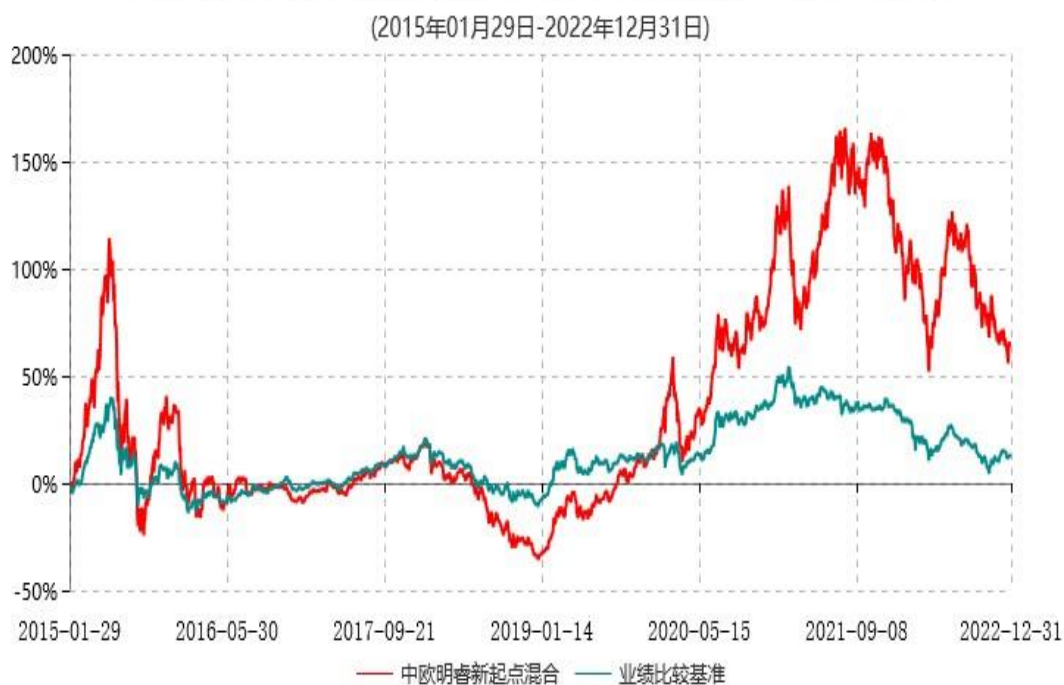
中欧明睿新起点混合型证券投资基金累计净值增长率与业绩比较基准收益率历史走势对比图