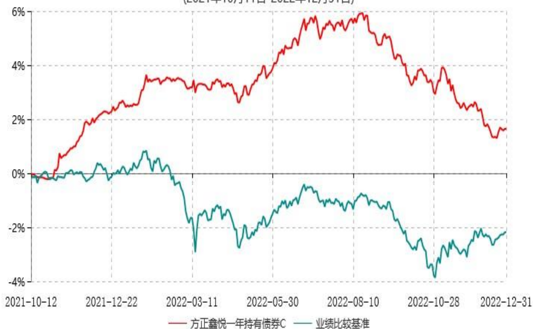
方正鑫悦一年持有债券C累计净值增长率与业绩比较基准收益率历史走势对比图 (2021年10月11日-2022年12月31日)

注：1、基金合同生效日为2021年09月16日，方正鑫悦一年持有债券C自2021年10月11日起开放申购和赎回业务。