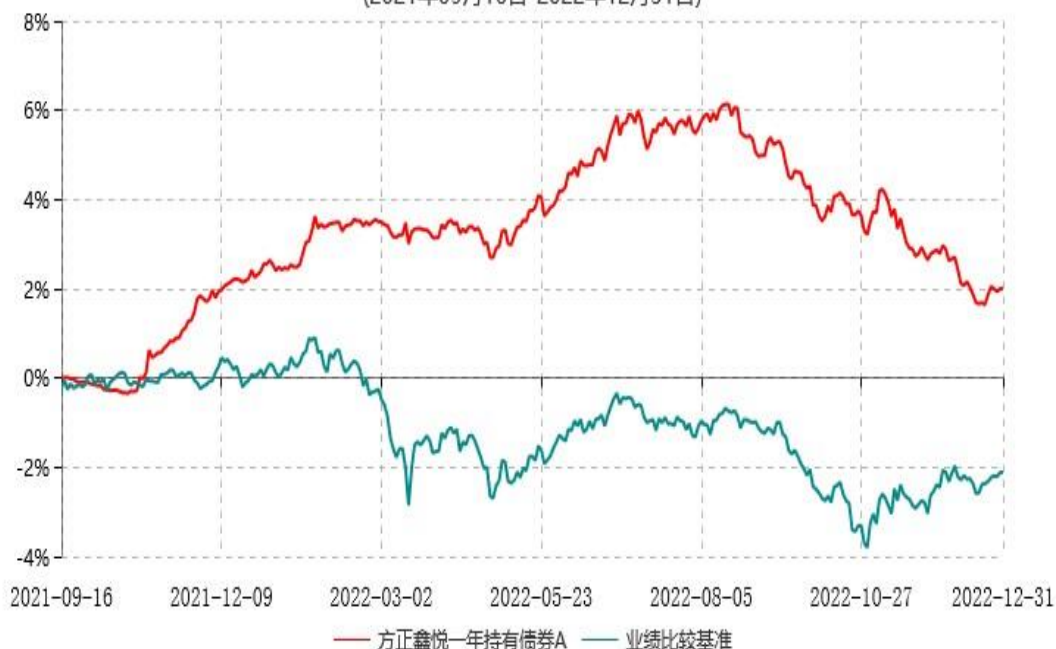
方正鑫悦一年持有债券A累计净值增长率与业绩比较基准收益率历史走势对比图 (2021年09月16日-2022年12月31日)

注：本基金合同于2021年09月16日生效，建仓期6个月，截至报告期末本基金已完成建仓，建仓期结束时各项资产配置比例符合基金合同约定。