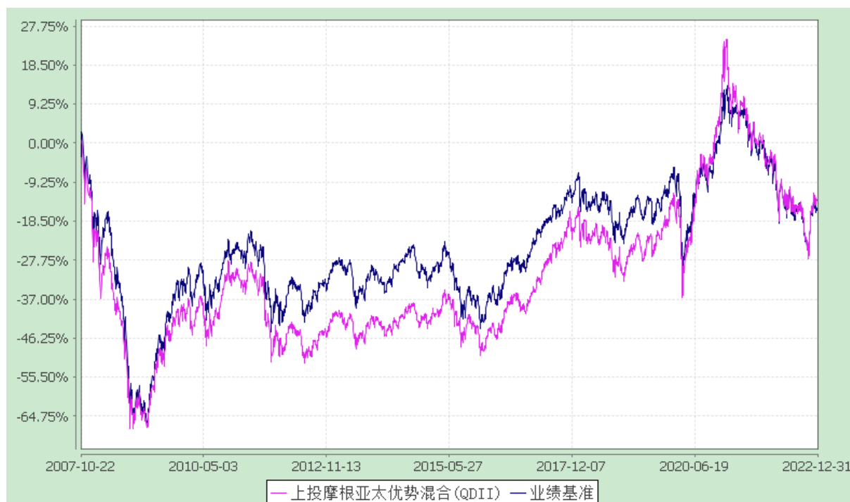
上投摩根亚太优势混合型证券投资基金 自基金合同生效以来份额累计净值增长率与业绩比较基准收益率历史走势对比图 (2007 年 10 月 22 日至 2022 年 12 月 31 日)

注：本基金合同生效日为 2007 年 10 月 22 日，图示的时间段为合同生效日至本报告期末。