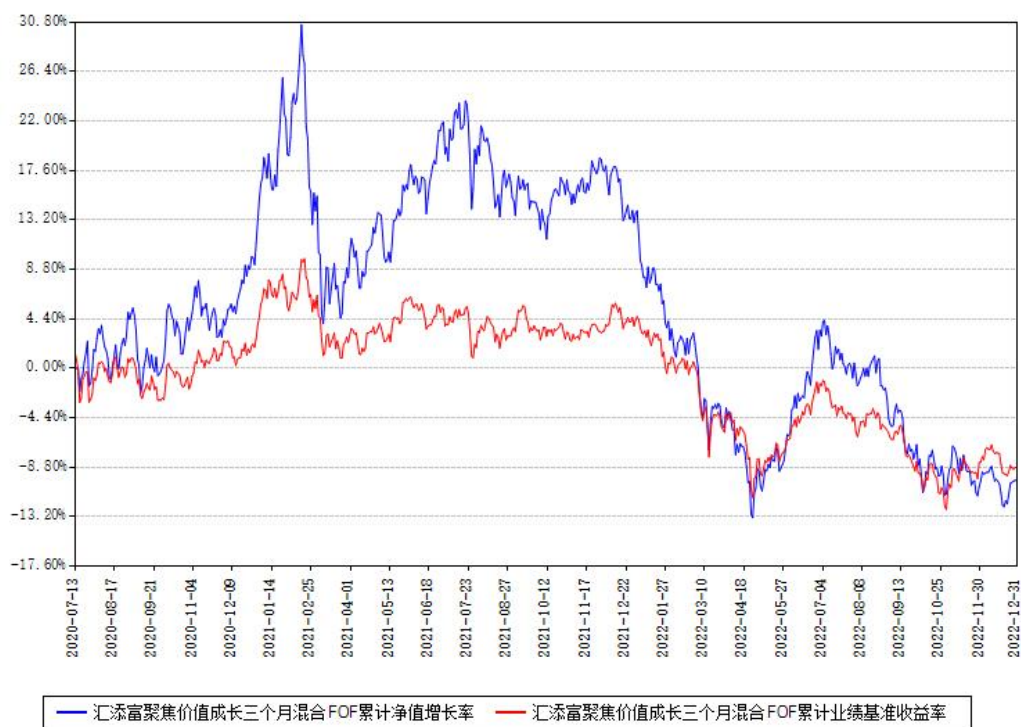
汇添富聚焦价值成长三个月混合 FOF 累计净值增长率与同期业绩基准收益率对比图

注：本基金建仓期为本《基金合同》生效之日（2020年07月13日）起6个月，建仓期结束时各项资产配置比例符合合同约定。