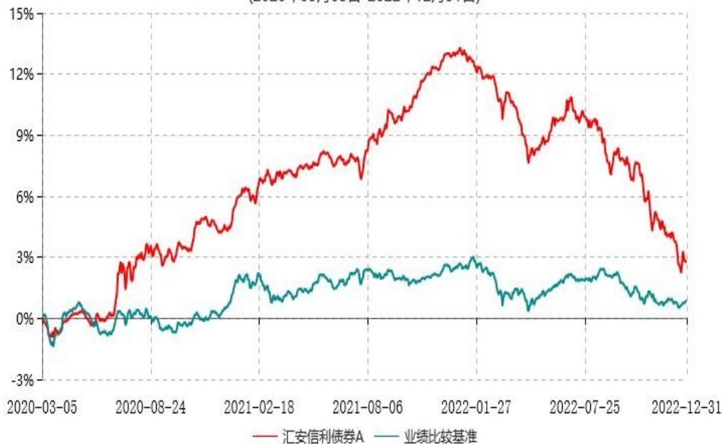
汇安信利债券C累计净值增长率与业绩比较基准收益率历史走势对比图