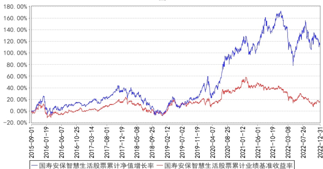
国寿安保智慧生活股票累计净值增长率与同期业绩比较基准收益率的历史走势对比图

注：本基金基金合同生效日为 2015 年 09 月 01 日，按照本基金的基金合同规定，自基金合同生效之日起 6 个月内使基金的投资组合比例符合基金合同关于投资范围和投资限制的有关约定。本基金建仓期结束时各项资产配置比例符合基金合同约定。图示日期为 2015 年 09 月 01 日至 2022 年 12 月 31 日。