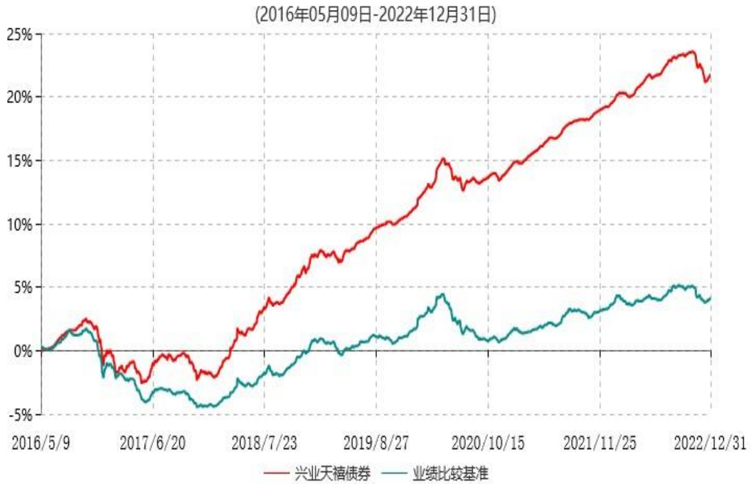
兴业天禧债券型证券投资基金累计净值增长率与业绩比较基准收益率历史走势对比图