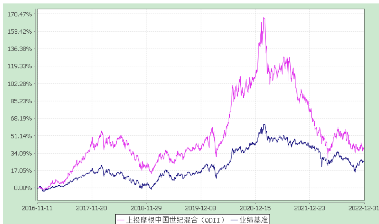
上投摩根中国世纪灵活配置混合型证券投资基金（QDII） 自基金合同生效以来份额累计净值增长率与业绩比较基准收益率历史走势对比图 (2016 年 11 月 11 日至 2022 年 12 月 31 日)

注：本基金合同生效日为 2016 年 11 月 11 日，图示的时间段为合同生效日至本报告期末。