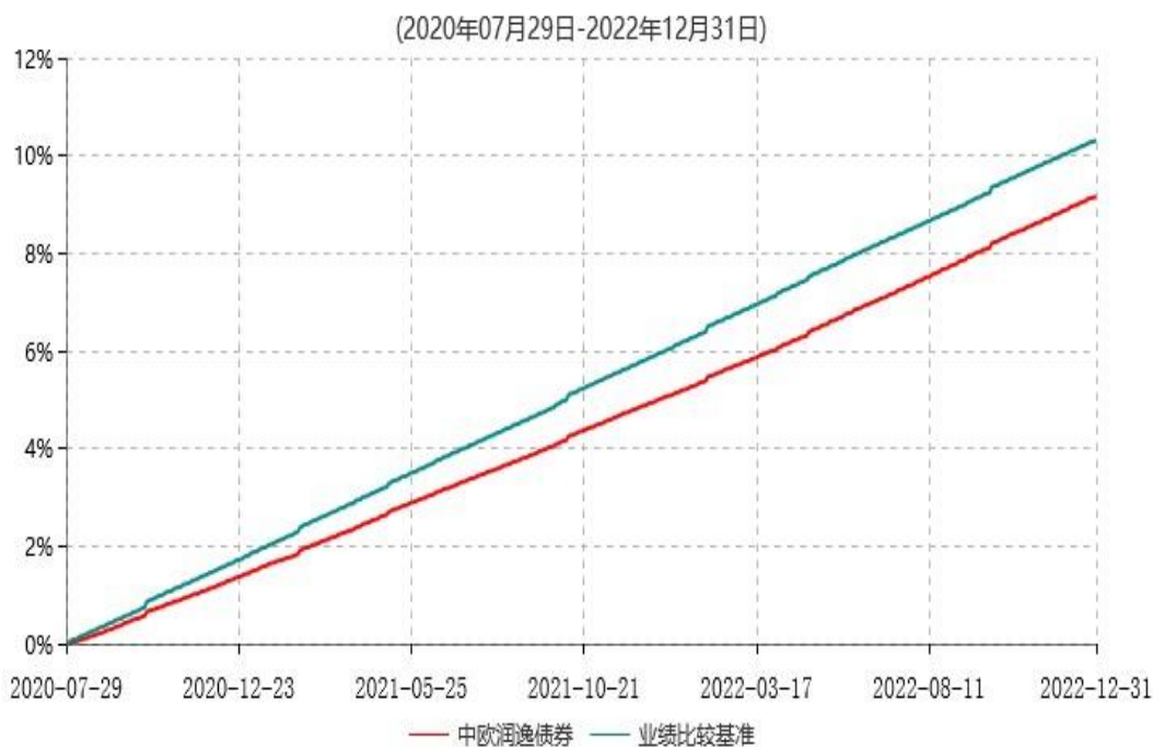
中欧润逸63个月定期开放债券型证券投资基金累计净值增长率与业绩比较基准收益率历史走势对比图