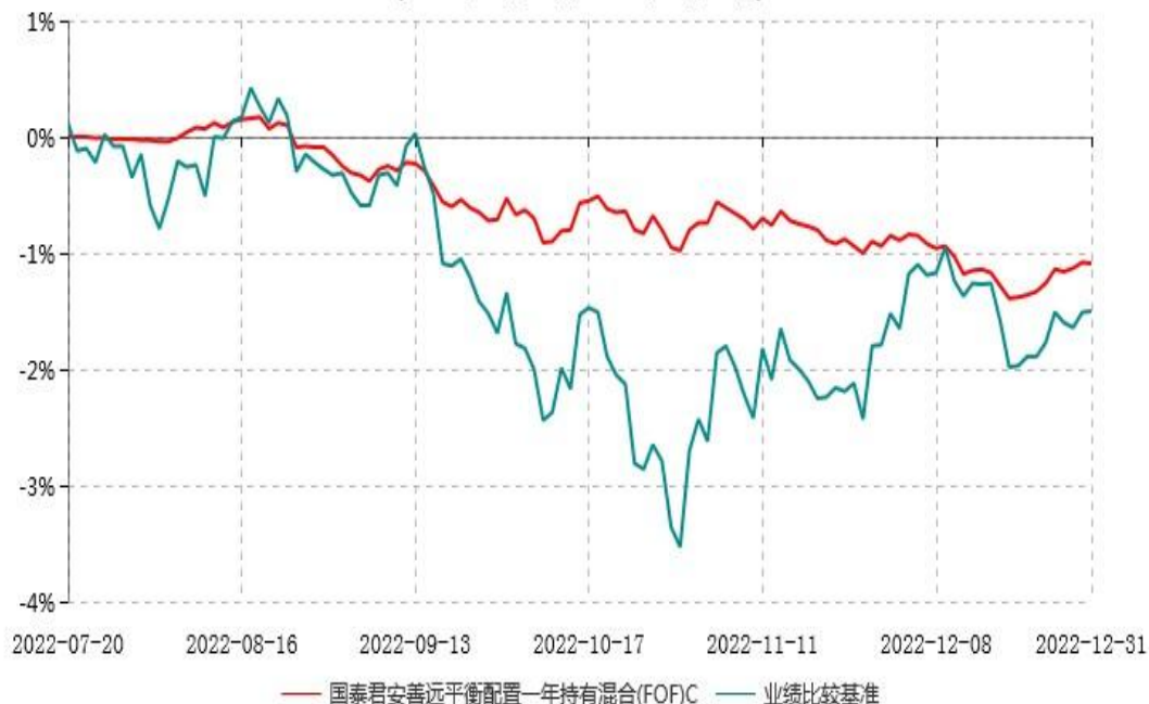
国泰君安善远平衡配置一年持有混合(FOF)C累计净值增长率与业绩比较基准收益率历史走势对比图 (2022年07月20日-2022年12月31日)

注：1、本基金于2022年7月20日成立，自合同生效日起至本报告期末不足一年。 2、按基金合同和招募说明书的约定，本基金的建仓期为六个月，建仓期结束时各项资产配置比例符合基金合同的有关约定。