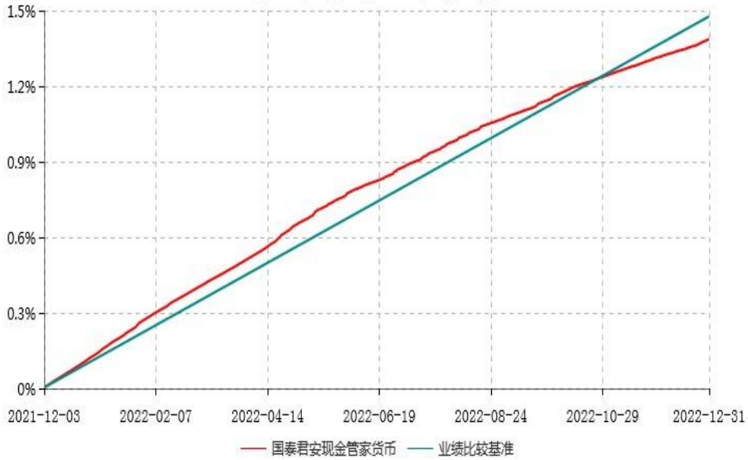
国泰君安现金管家货币市场基金累计净值收益率与业绩比较基准收益率历史走势对比图 (2021年12月03日-2022年12月31日)