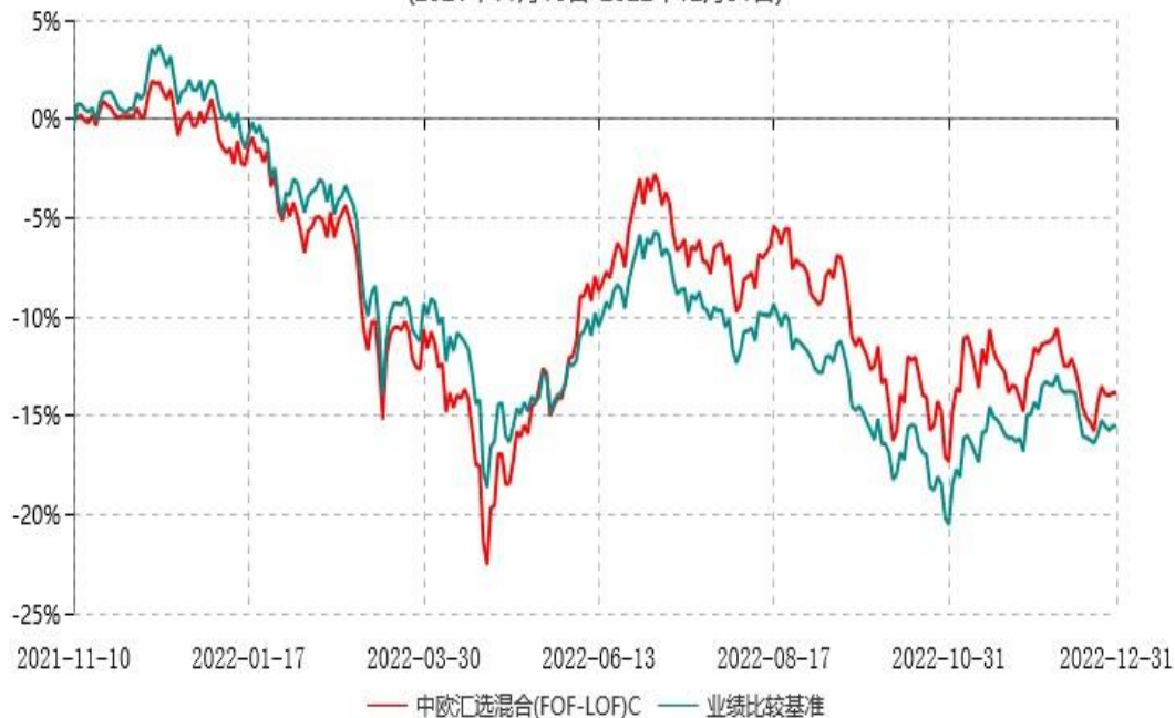
中欧汇选混合(FOF-LOF)C累计净值增长率与业绩比较基准收益率历史走势对比图 (2021年11月10日-2022年12月31日)

注：本基金基金合同生效日期为2021年11月10日，按基金合同的规定，本基金自基金合同生效起六个月为建仓期，建仓期结束时各项资产配置比例已符合基金合同约定。