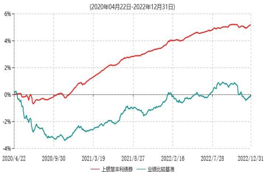
上银慧丰利债券型证券投资基金累计净值增长率与业绩比较基准收益率历史走势对比图

注：本基金合同生效日为2020年4月22日，自基金合同生效日起6个月内为建仓期，建仓期结束时资产配置比例符合基金合同约定。