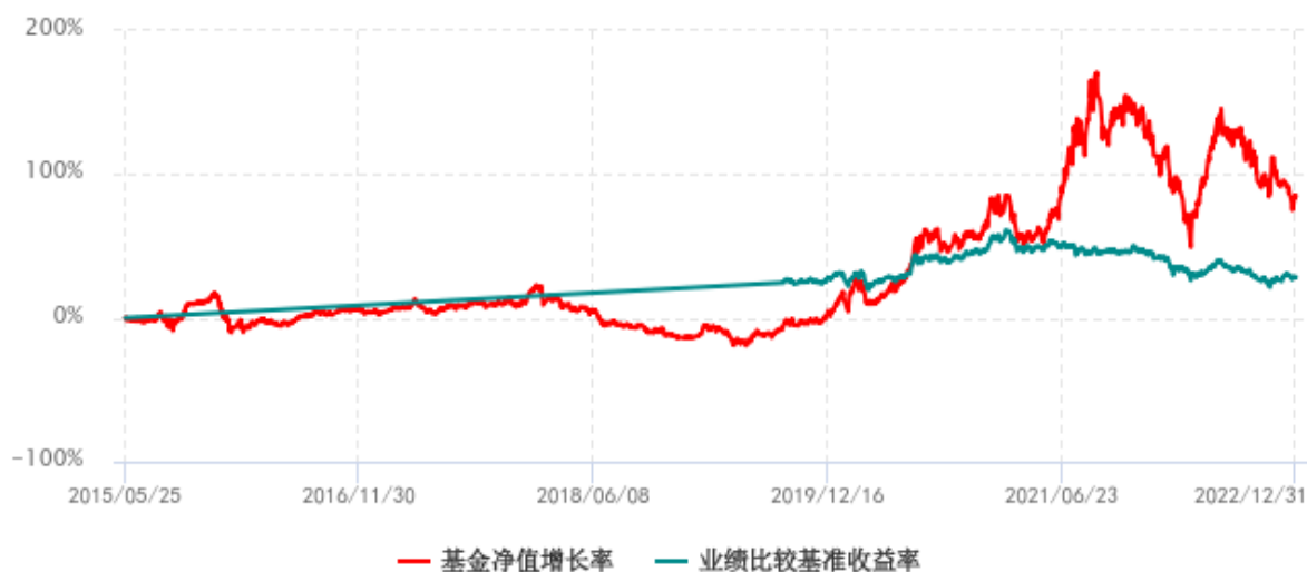
基金份额累计净值增长率与同期业绩比较基准收益率历史走势对比图 (2015年05月25日-2022年12月31日)