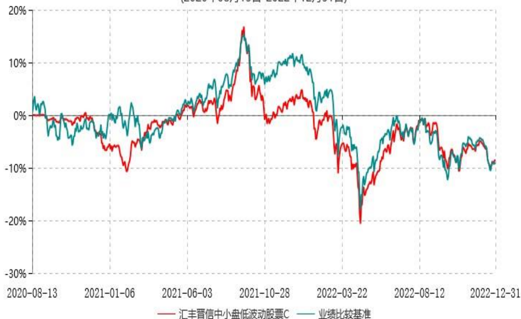
汇丰晋信中小盘低波动策略股票C累计净值增长率与业绩比较基准收益率历史走势对比图 (2020年08月13日-2022年12月31日)