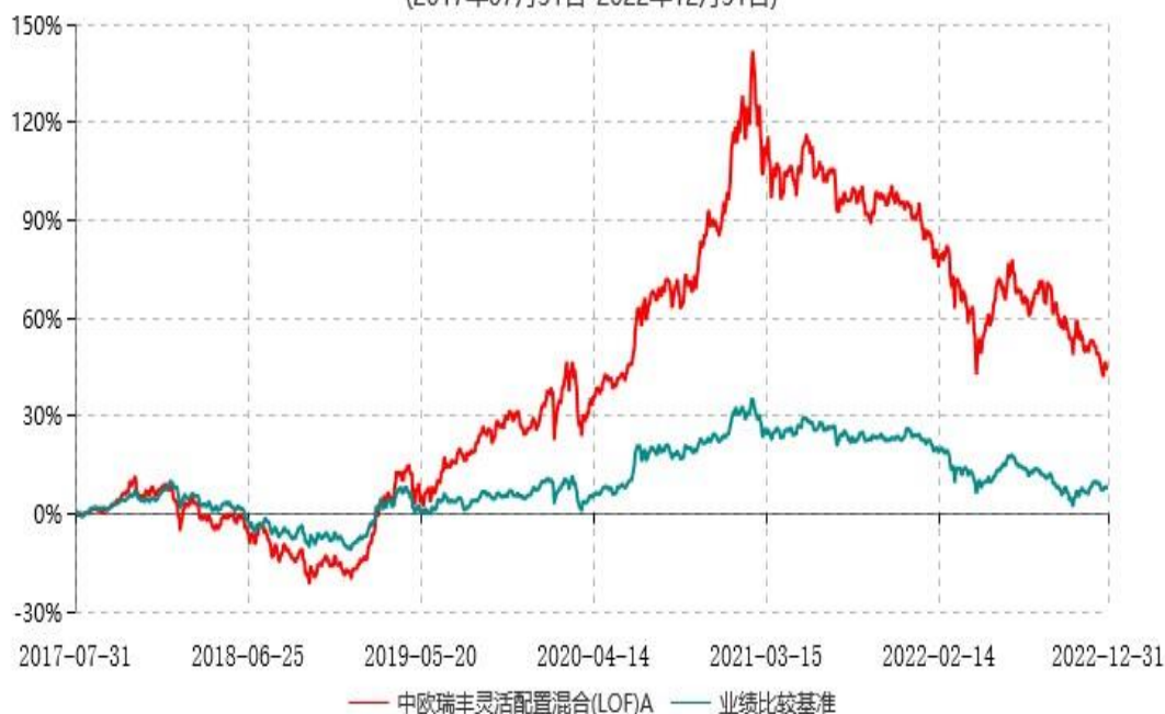
中欧瑞丰灵活配置混合(LOF)A累计净值增长率与业绩比较基准收益率历史走势对比图 (2017年07月31日-2022年12月31日)