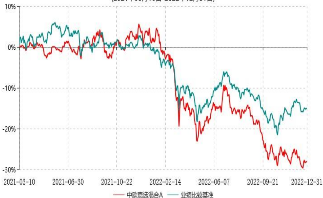
中欧嘉选混合C累计净值增长率与业绩比较基准收益率历史走势对比图