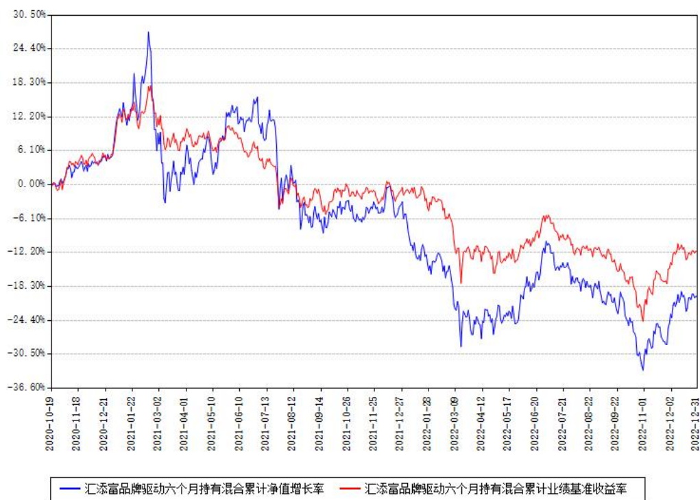
汇添富品牌驱动六个月持有混合累计净值增长率与同期业绩基准收益率对比图

注：本基金建仓期为本《基金合同》生效之日（2020年10月19日）起6个月，建仓期结束时各项资产配置比例符合合同约定。