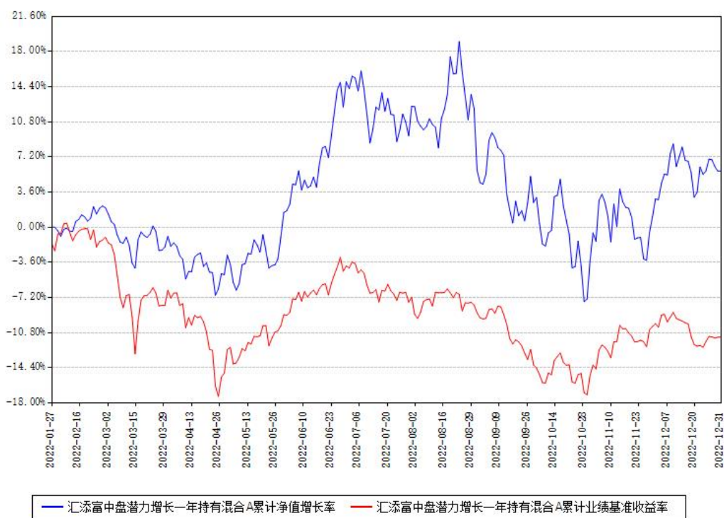
汇添富中盘潜力增长一年持有混合A累计净值增长率与同期业绩比较基准收益率对比图