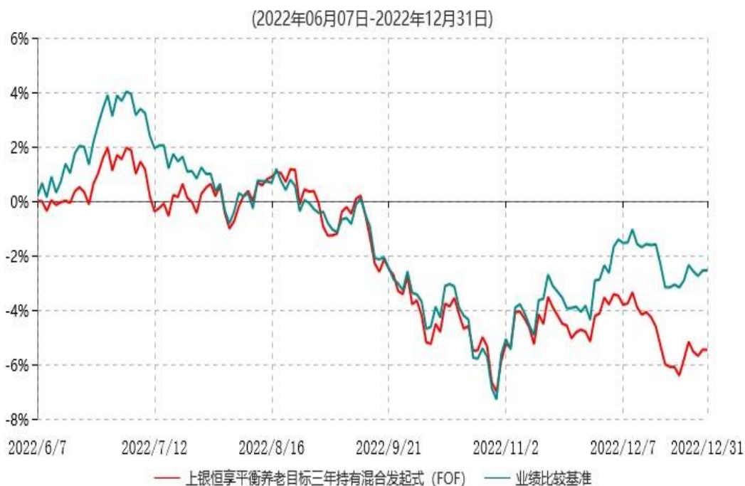
上银恒享平衡养老目标三年持有期混合型发起式基金中基金（FOF）累计净值增长率与业绩比较基准收益率历史走势对比图

注：本基金合同生效日为2022年6月7日，自基金合同生效日起6个月内为建仓期，建仓期结束时各项资产配置比例符合基金合同约定；截至本报告期末，基金合同生效不满一年。