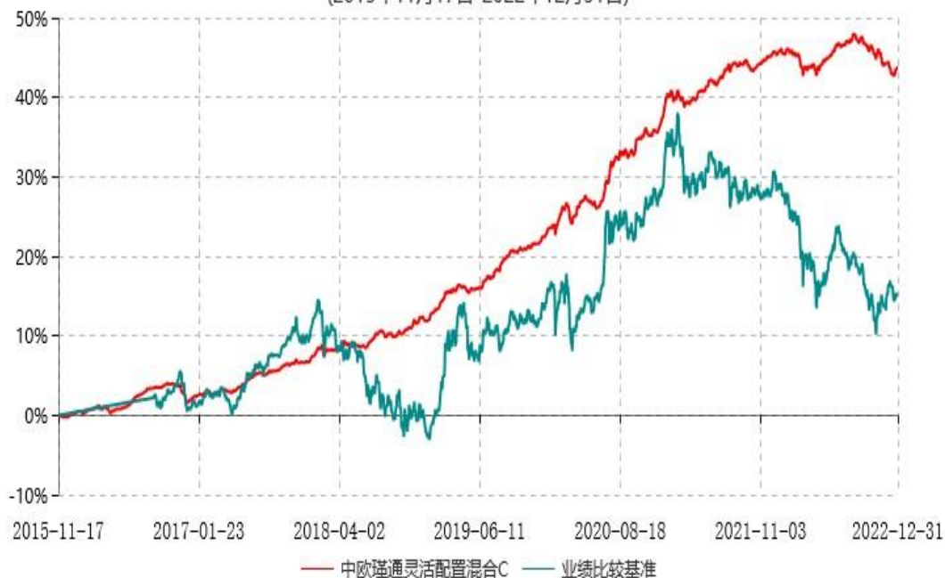
中欧瑾通灵活配置混合C累计净值增长率与业绩比较基准收益率历史走势对比图 (2015年11月17日-2022年12月31日)

注：自2016年9月5日起，业绩比较基准由金融机构人民币三年期定期存款基准利率（税后）变更至沪深300指数收益率*50%+中债综合指数收益率*50%。