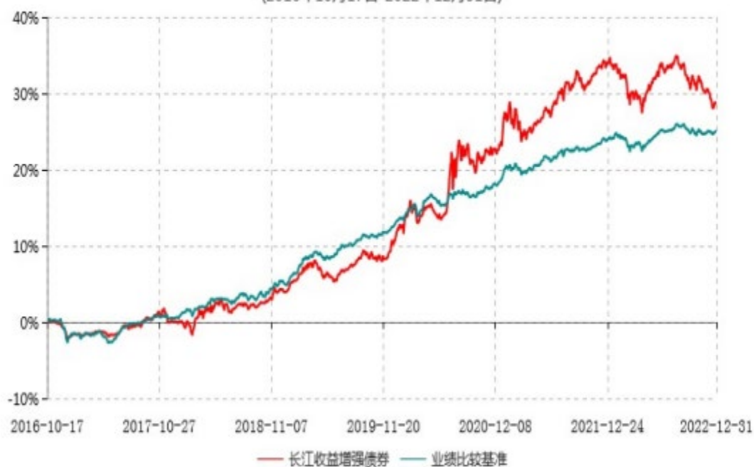
长江收益增强债券型证券投资基金累计净值增长率与业绩比较基准收益率历史走势对比图 (2016年10月17日-2022年12月31日)