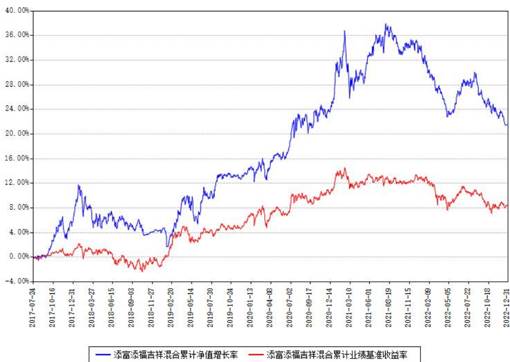
添富添福吉祥混合累计净值增长率与同期业绩基准收益率对比图

注：本基金建仓期为本《基金合同》生效之日（2017年07月24日）起6个月，建仓期结束时各项资产配置比例符合合同约定。